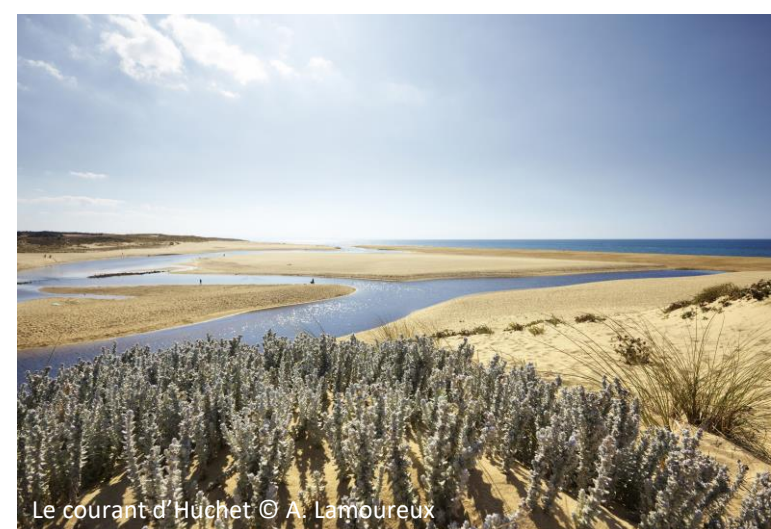
Le courant d'Huchet

☾ 2 jours / 1 nuit → 80 km 📶 Débutant à intermédiaire