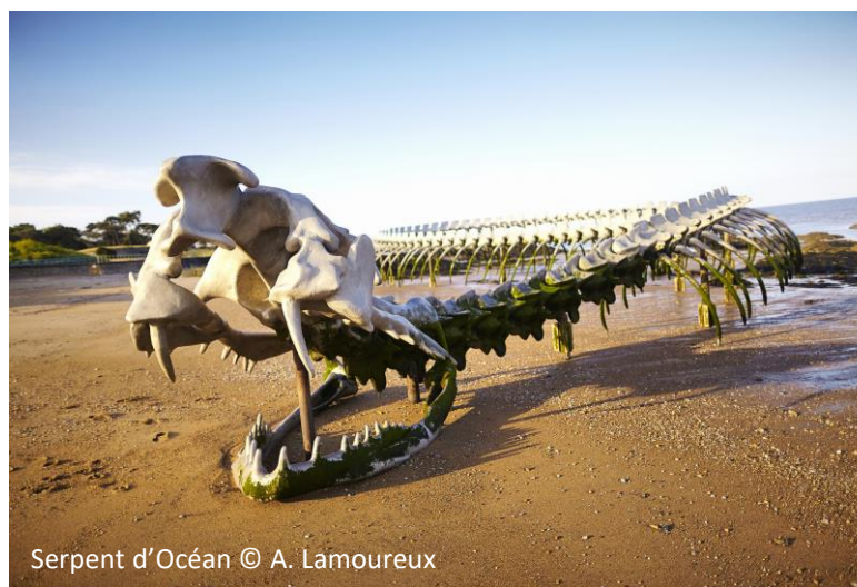
Serpent d'Océan

☾ 2 jours / 1 nuit → 62 km 📶 Débutant à intermédiaire