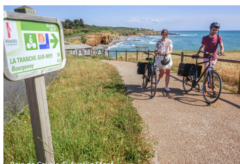
Baie de Cayola

☾ 2 jours / 1 nuit → 81 km 📶 Débutant à intermédiaire