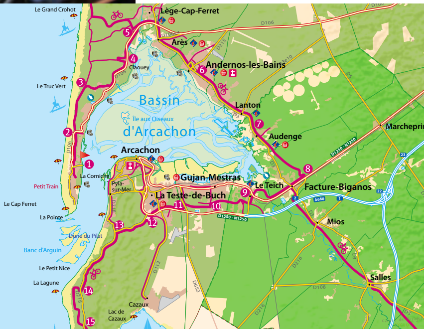
© DTI 33 / J. DAMASE